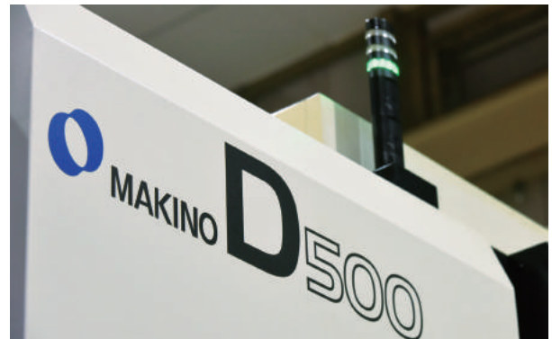
5軸マシニングセンター